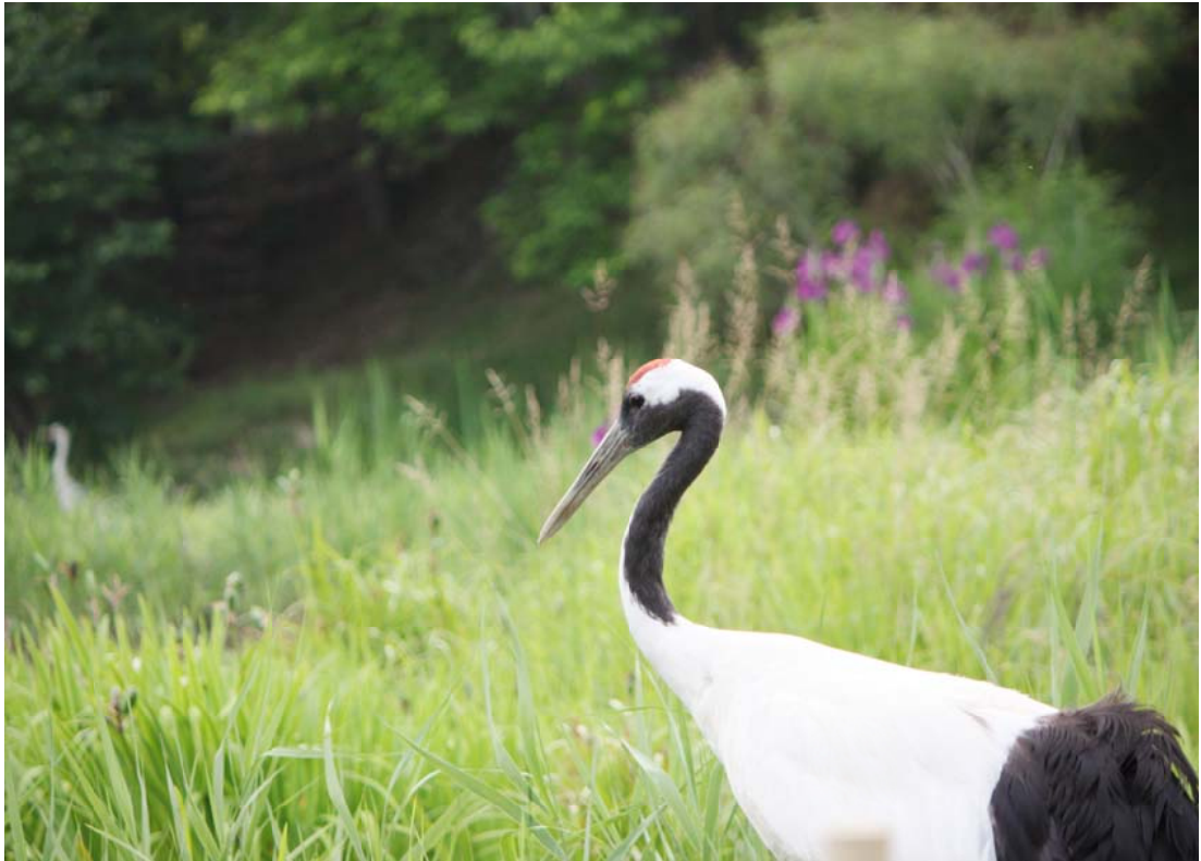
岡山県自然保護センター（和気町田賀）にて撮影