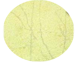
顕微鏡でみた水虫

水虫の原因は、カビの一種である「白癬菌（はくせんきん）」です。皮膚の一番外側の層（角質層）に住みつき、環境に合わせて形を変えながら、しぶとく生き延びる性質を持っています。それが治りにくい理由にもなっています。